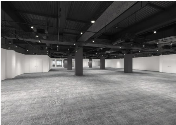
「なんばパークスミュージアム」内装(イメージ)