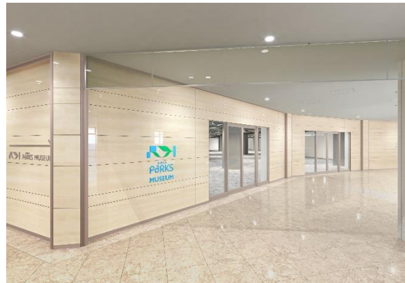
「なんばパークスミュージアム」外観(イメージ)

南海電気鉄道株式会社(社長:岡嶋 信行)では、難波駅直結の大型複合商業施設「なんばパークス」に、展示・多目的ホール機能を有した、「なんばパークスミュージアム」を2024年4月に開業します。